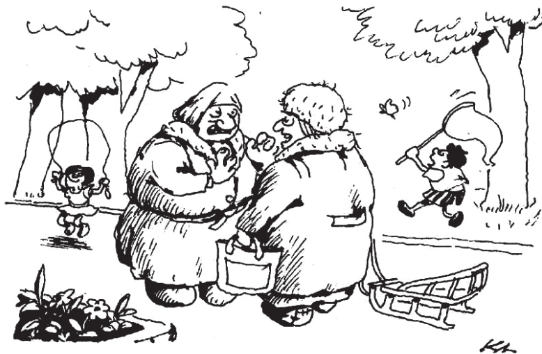
РИС. С. КУЛЬМИШКЕНОВА (АКМОЛА)