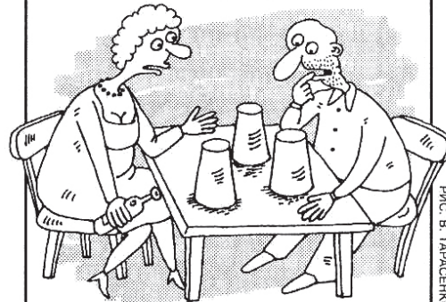
РИС. В. ТАРАСЕНКО (МУРМАНСК)